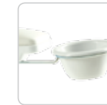
manicure bowls bacinelle manicure cod. 006