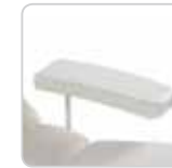
arm rest couple coppia di braccioli cod. 076