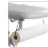
paper roll holder portarotolo cod. 108