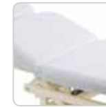
bed sponge cover copri lettino cod. 114