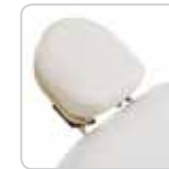
headrest w/out hole testa senza foro cod. 077/A