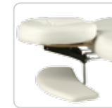
arm support supporto braccia cod. 076/bis