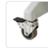
wheels ruote cod. LEM-139