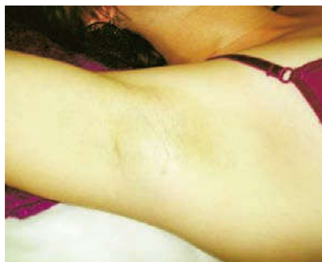
Po 3 fotoepiliacijos seansų